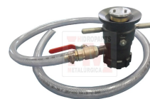
ESGUICHO ÁGUA-ESPUMA - HM153