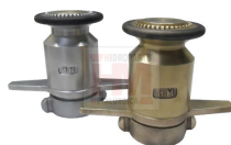
ESGUICHO FOG-HOG - HM151